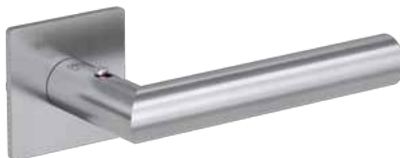
Türgriff LUCIA mit Smart2lock und eckiger Flachrosette. (Bild: GRIFFWERK GmbH)