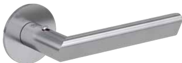
Besonders komfortabel mit ergonomischem, dreiseitigem Profil: Türgriff TRI mit Smart2lock by GRIFFWERK