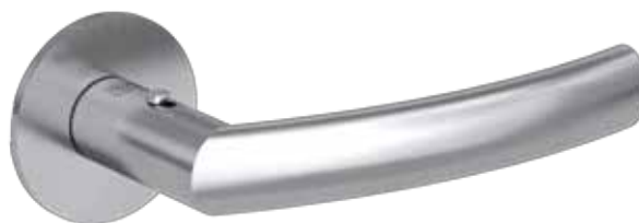
Auch Türgriff CRYSTAL (Design: Jette Joop) ist jetzt mit Smart2lock by GRIFFWERK erhältlich.