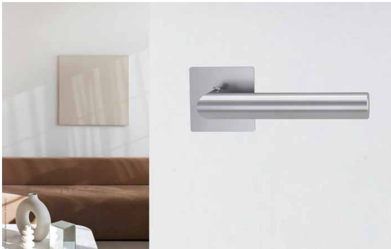
Eine neue, schlichte Türenästhetik durch Flachrosetten und integrierte Schließtechnik smart2lock by GRIFFWERK.