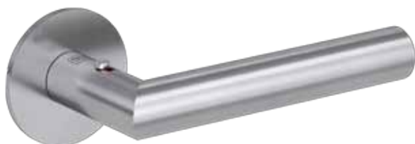
Türgriff LUCIA mit Smart2lock und runder Flachrosette.