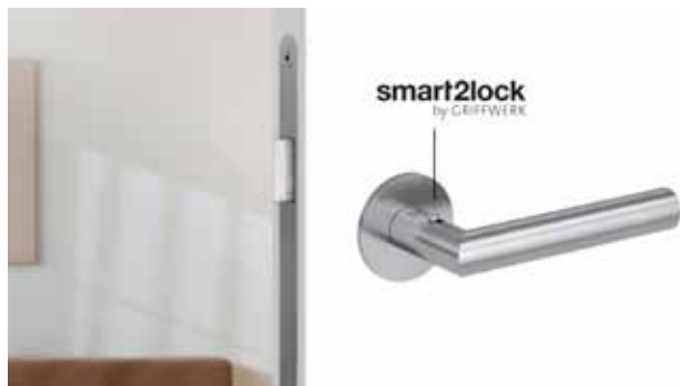
LUCIA PIATTA mit smart2lock by GRIFFWERK.