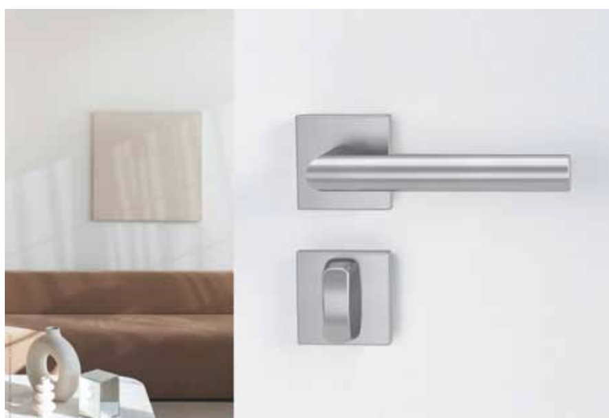
Konventionelle Garnituren ohne smart2lock benötigten Schließrosetten und WC-Riegel.