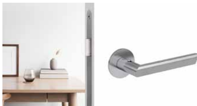
Griff TRI PIATTA mit smart2lock by GRIFFWERK.