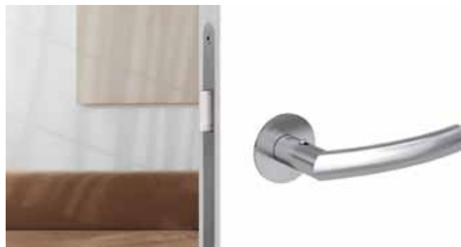
LORITA PIATTA mit smart2lock by GRIFFWERK.