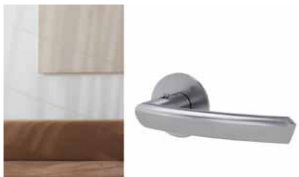
Griff CRYSTAL PIATTA (Design: Jette Joop) mit smart2lock by GRIFFWERK.