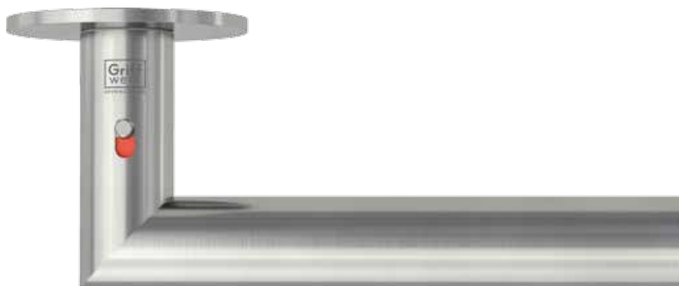
Türgriff LUCIA PIATTA mit Smart2lock: Die integrierte Verriegelungstechnik macht die Bedienung besonders komfortabel.