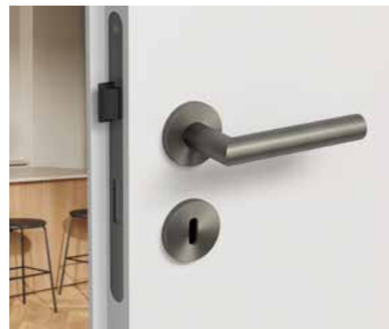
UVERO 302 Design-Schloss mit LUCIA BB in Kaschmirgrau.