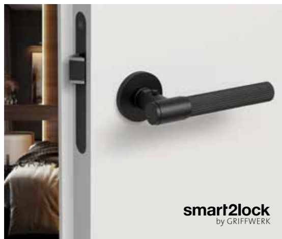
UVERO 301 Design-Schloss S mit ARIS smart2lock in Graphitschwarz.