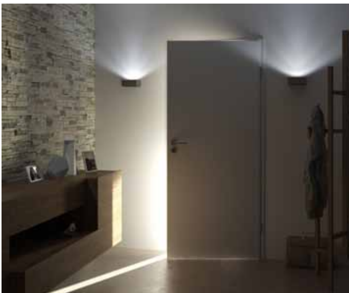
Holztüren lassen kein Licht in fensterlose Räume

Lichtgewinn durch Glastüren für fensterlose Räume. Die gelasserte Glastür der Themengruppe „Typographie“ in TWOSIDE by GRIFFWERK mit rückseitiger Satinierung schirmt Blicke besser ab.