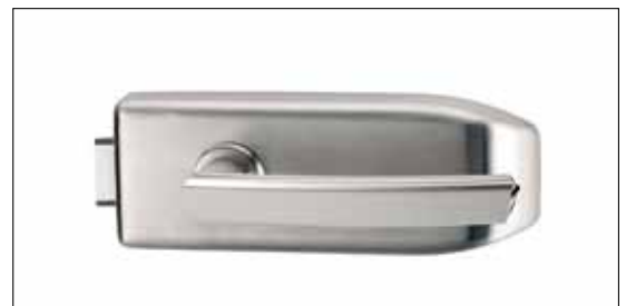
Türgriff CRYSTAL der Designerin Jette Joop in Kombination mit dem Schlosskasten CREATIVO ist in Design und Technik abgestimmt.