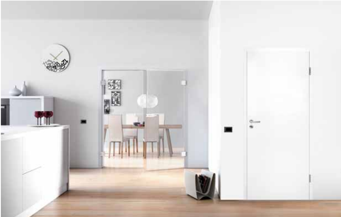
Lichtoffene aber trennbare Funktionsbereiche dank Glastüren. ( Glastür WAVE der Designerin Jette Joop)