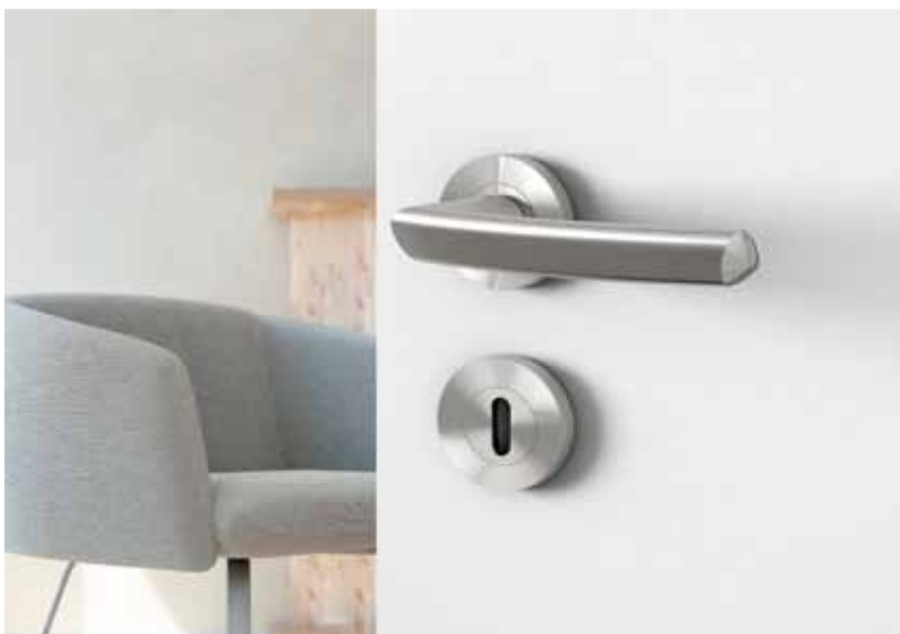
Türgriff CRYSTAL der Designerin Jette Joop ist für Glas- und Holztüren erhältlich. (Design: Jette Joop für GRIFFWERK)