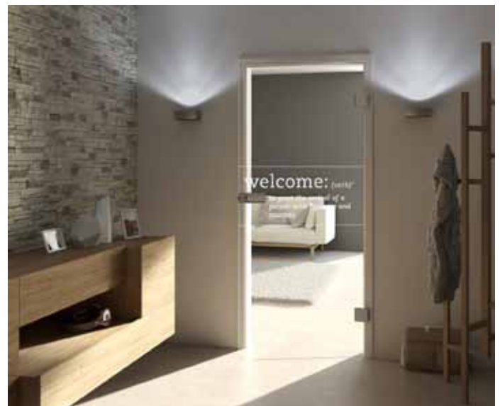
Mehr Lichtgewinn mit Glastüren. Hier mit Laserdekor aus der Themengruppe „Typographie“