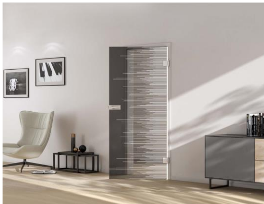
VSG-Türen gibt es bei GRIFFWERK jetzt gelasert und optional in Rauchglas